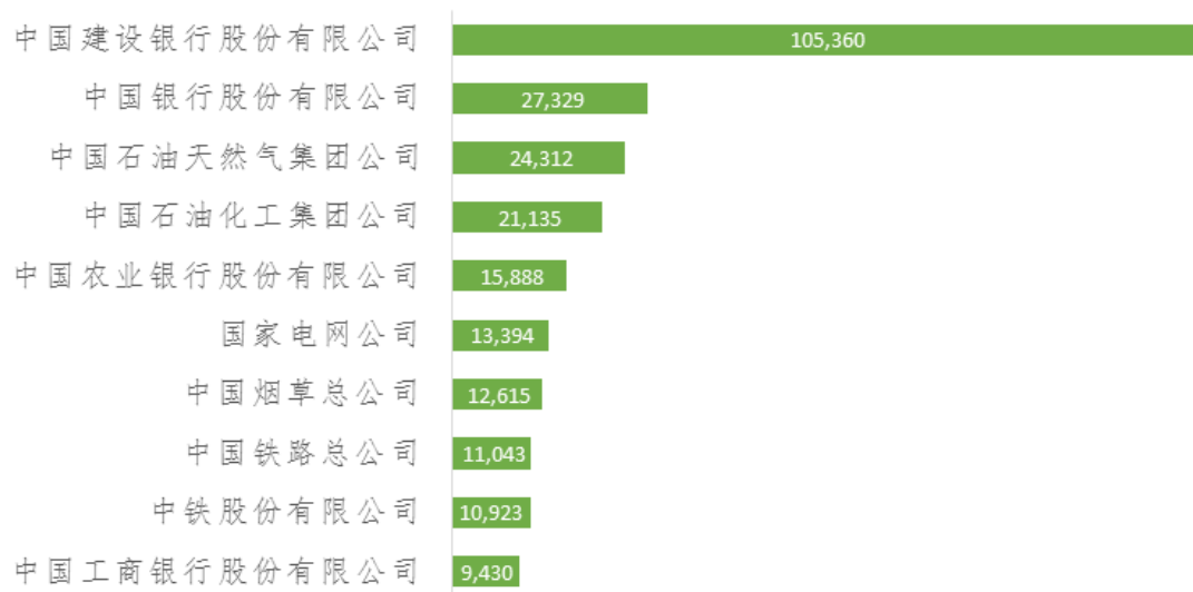
图 1： 中央国有企业参赛人数排名